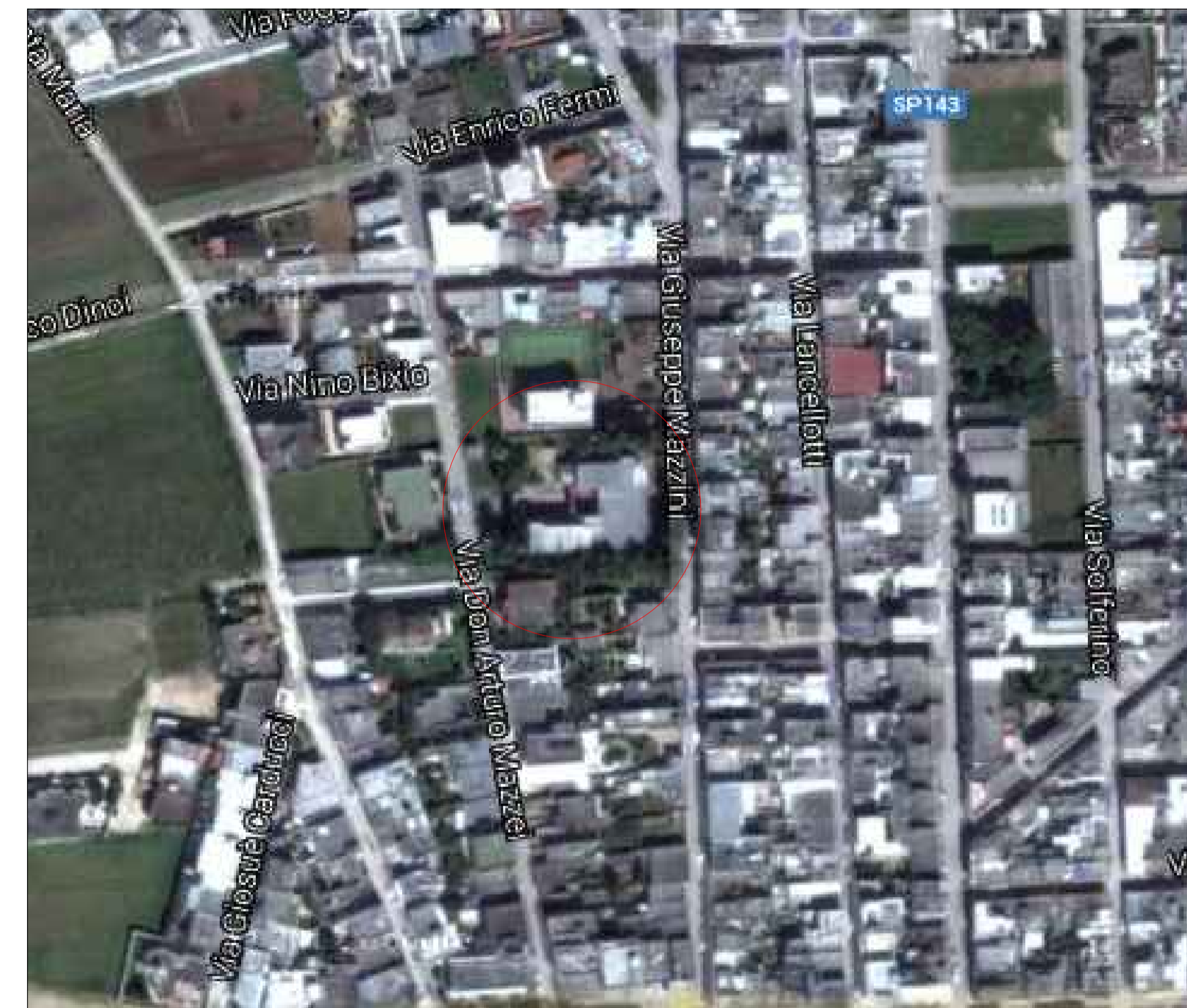
Vista satellitare F.S.